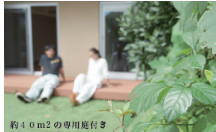
約40m 2 の専用庭付き