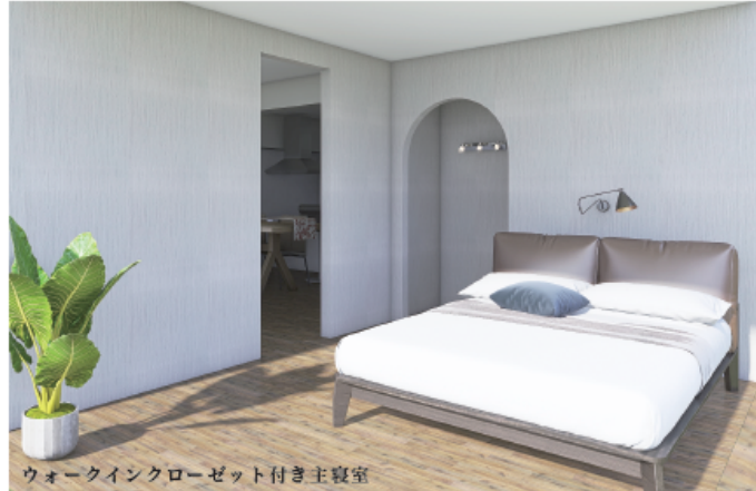
ウォークインクローゼット付き主寝室